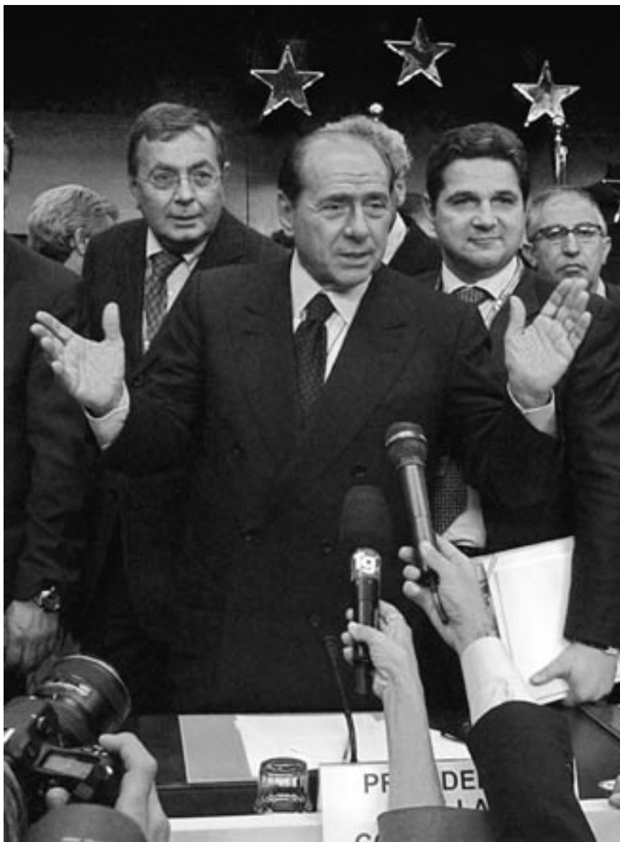
Silvio Berlusconi hovoří na tiskové konferenci na závěr summitu Evropské unie v Bruselu.

které jsou více méně reprezentovány toliko přímým zastoupením občanů v Evropském parlamentu a nepřímou prostřednictvím zástupců exekutiv v Radě ministrů, se tak fakticky mohou dále rozvolňovat. Jinými slovy, diskuse, které nyní probíhají na úrovni celoevropské, nenacházejí patřičnou reflexi na úrovni vnitrostátní, resp. pro tuto reflexi ani nevzniká dostatečný časový prostor. Větší dynamika integrace tak kontraproduktivně může způsobovat stále větší rozvolňování těchto vazeb a ve svém výsledku vést ke snižování identifikace jednotlivých aktérů (občanů, politických stran, členských států atd.) s integrací jako takovou. Je tak pouze otázkou času, kdy se tento