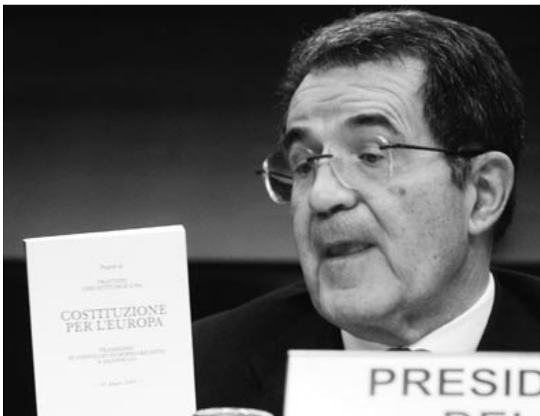
Romano Prodi sleduje návrh Evropské ústavy na tiskové konferenci po závěru summitu EU 13. prosince v Bruselu.

V závěru Konventu byly 13. června 2003 předloženy části I., II. a IV. Ústavy. Předpokládalo se, že ohledně části III. bude ještě vedena další diskuse. Několik konkrétních otázek proto zůstávalo otevřených. Evropská lidová strana nicméně konstatovala všeobecné potěšení z výsledků Konventu, který označila za historický úspěch a vyvážený kompromis, který je v zájmu občanů EU. Díky ústavě se podle Evropské lidové strany stane Evropa demokratičtější a transparentnější. V druhé polovině června prostřednictvím vystoupení Hans-Gerta Poetteringa, Elmara Broka a další představitelů Evropská lidová strana prezen-