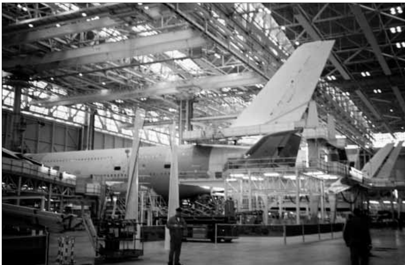
Výroba letadel vyvolala obchodní spor mezi EU a USA