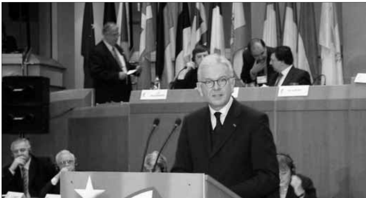
Předseda frakce EPP-ED v Evropském parlamentu Hans-Gert Poettering

Členské státy WTO by měly vedle jednání o zlepšení přístupu průmyslového zboží na trh a jednání o rozsáh-