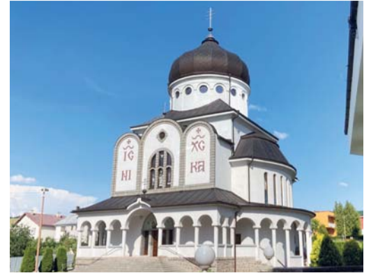
Řeckokatolický chrám ve Stropkově posvětil roku 1949 blahoslavení Pavel Peter Gojdič a Vasil Hopko.

Díky filmu divák pochopí více z východní spirituality i mnoho z její symboliky a zároveň se stává svědkem řeckokatolické víry jako integrální součásti života východoslovenských věřících. Proč by mělo být vlastně nezvyklé vidět moderně oblečené pubertáky, jak se sklánějí nad mariánskou ikonu ozářenou desítkami plamínků? O „krají, kde náboženství a církevní příslušnost tvoří součást osobní identity člověka“ hovoří ostatně i anotace této série, která je právě tak poučením o důležité větvi katolické církve, jako i pozváním k návštěvě překrás-