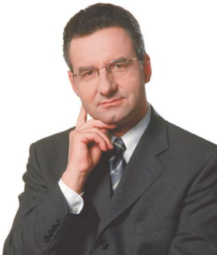
Ing. Jan Zahradil předseda klubu poslanců ODS v Evropském parlamentu